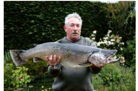
La truite de mer record pêchée sur la Touques le 5 juin 2012

L'heureux pêcheur en a prélevé des écailles qui ont permis de découvrir que ce mâle était âgé de 5 ans et qu'il avait frayé 2 fois.