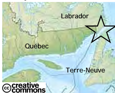
Le détroit de Belle-Isle

Sur la côte Est de l'Amérique du nord, les smolts (juvéniles de saumons) et les kelts (saumons adultes ayant frayé) semblent migrer vers le nord à travers le détroit de Belle-Isle (entre Terre-Neuve et le Labrador), notamment ceux de la rivière Miramichi. Et il semblerait qu'une bonne dose de grégarité préside à l'aller comme au retour de leur voyage dans les eaux groenlandaises.